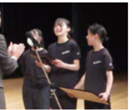
【奨励賞】ゆめが丘陸上クラブ