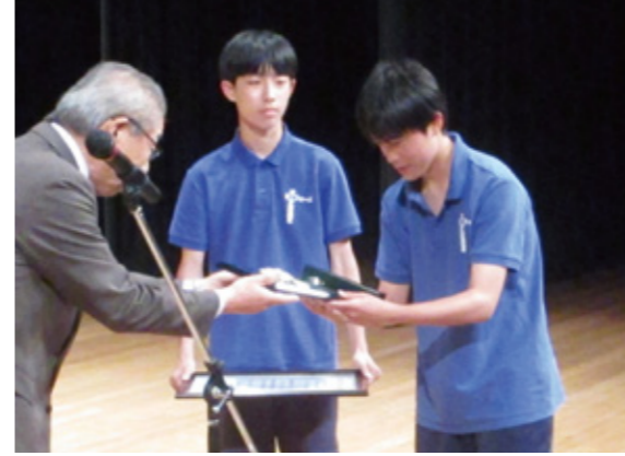
【功労賞】 E・フォース