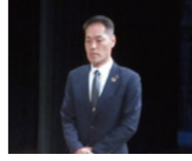
【奨励賞】伊賀FCくノ一三重