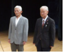
【奨励賞】伊賀オールズ